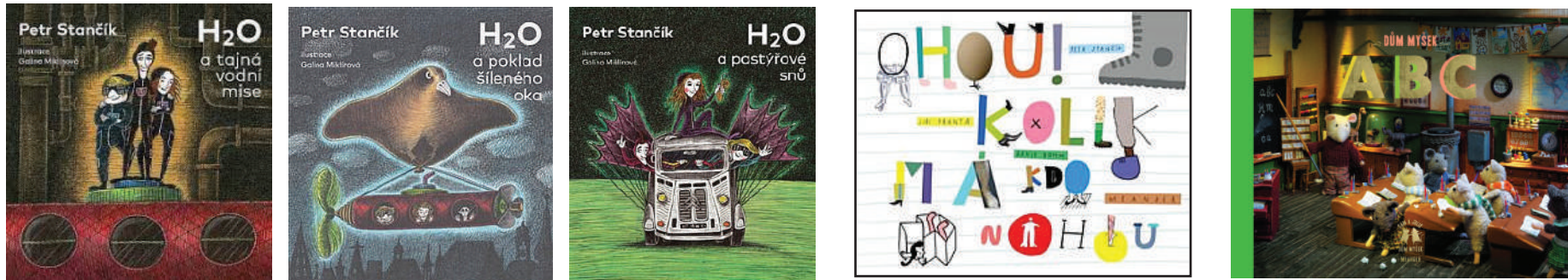
edition of books